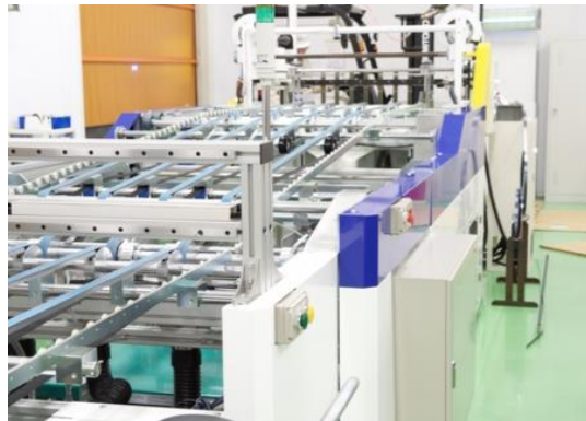
インクジェット読取装置